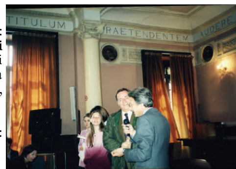
Gemellaggio con L'Ass. ex-Allievi del Liceo Tasso di Roma