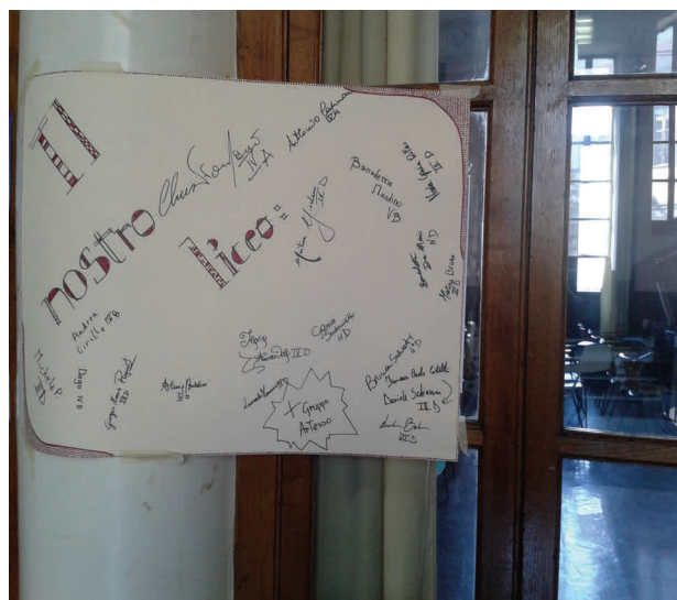
L'Orgoglio degli alunni

Forse, con il prossimo anno scolastico, potremmo pensare ad una mostra tematica, magari soltanto di fotografie.