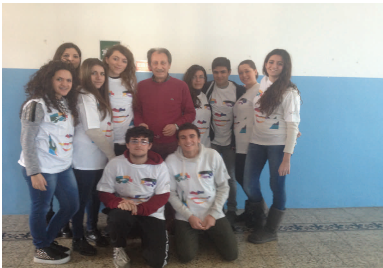
Gli Alunni della IV D che hanno collaborato all'allestimento

Sono trascorsi quasi due mesi e l'eco della Mostra Storica sul Liceo Tasso non si è ancora spenta! Alcuni ne parlano come di un piacevole ricordo, altri sono dispiaciuti di non averla potuta visitare, ed altri si chiedono se l'evento sarà ripetuto in futuro. Senza fare promesse si può ipotizzare un replay, o meglio un "repetita iuvant".